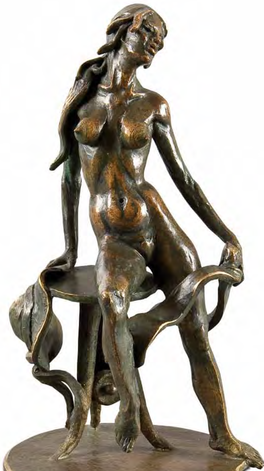
Cratere (part.) Bronzo