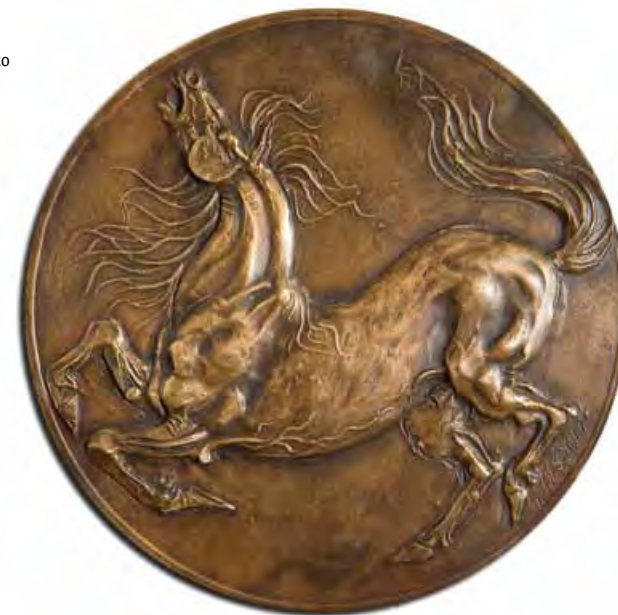
Cavallo ferito Bronzo