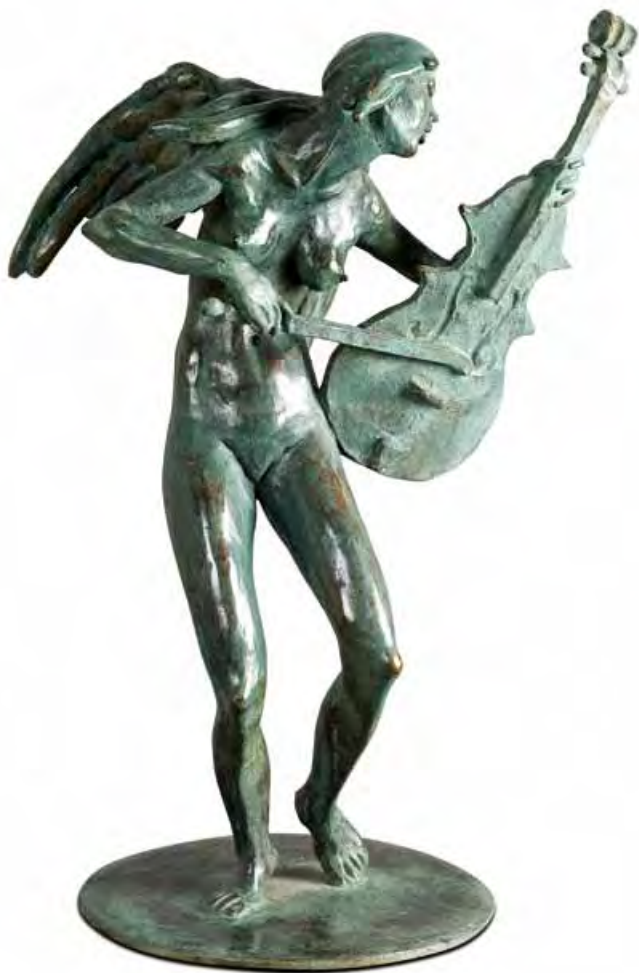
Cavallo in corsa Bronzo