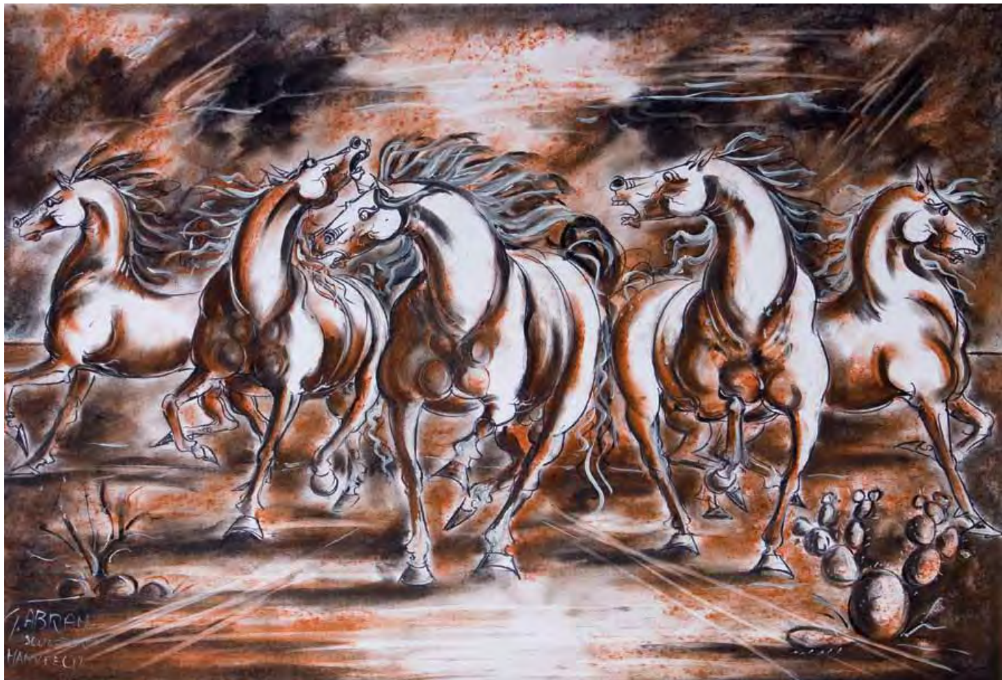
Cavalli in corsa Carboncino e sanguigna Paolo e Francesca Carboncino e sanguigna