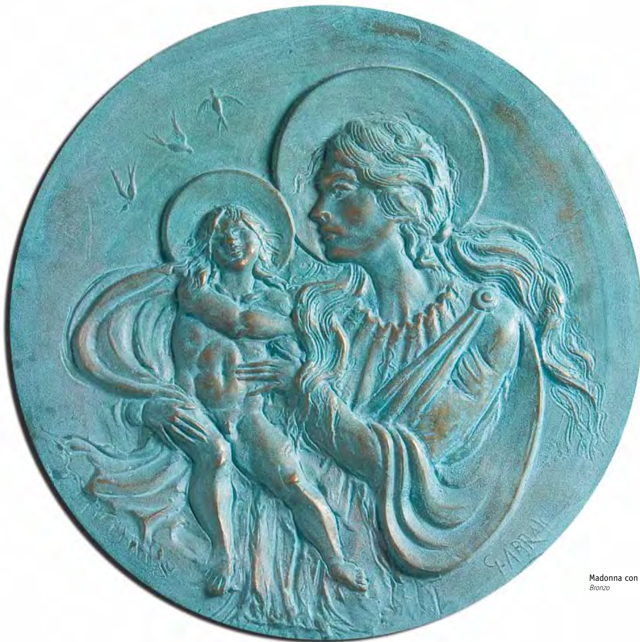
Madonna con bambino Bronzo