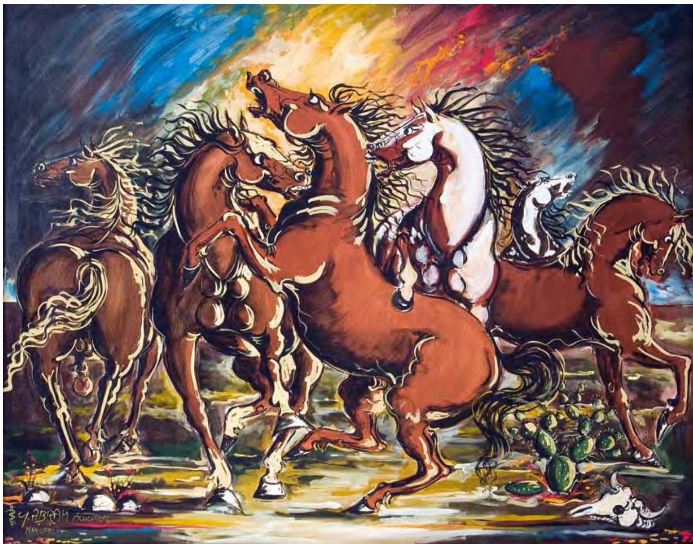
Rissa di stalloni Tecnica mista 120 x 160 cm