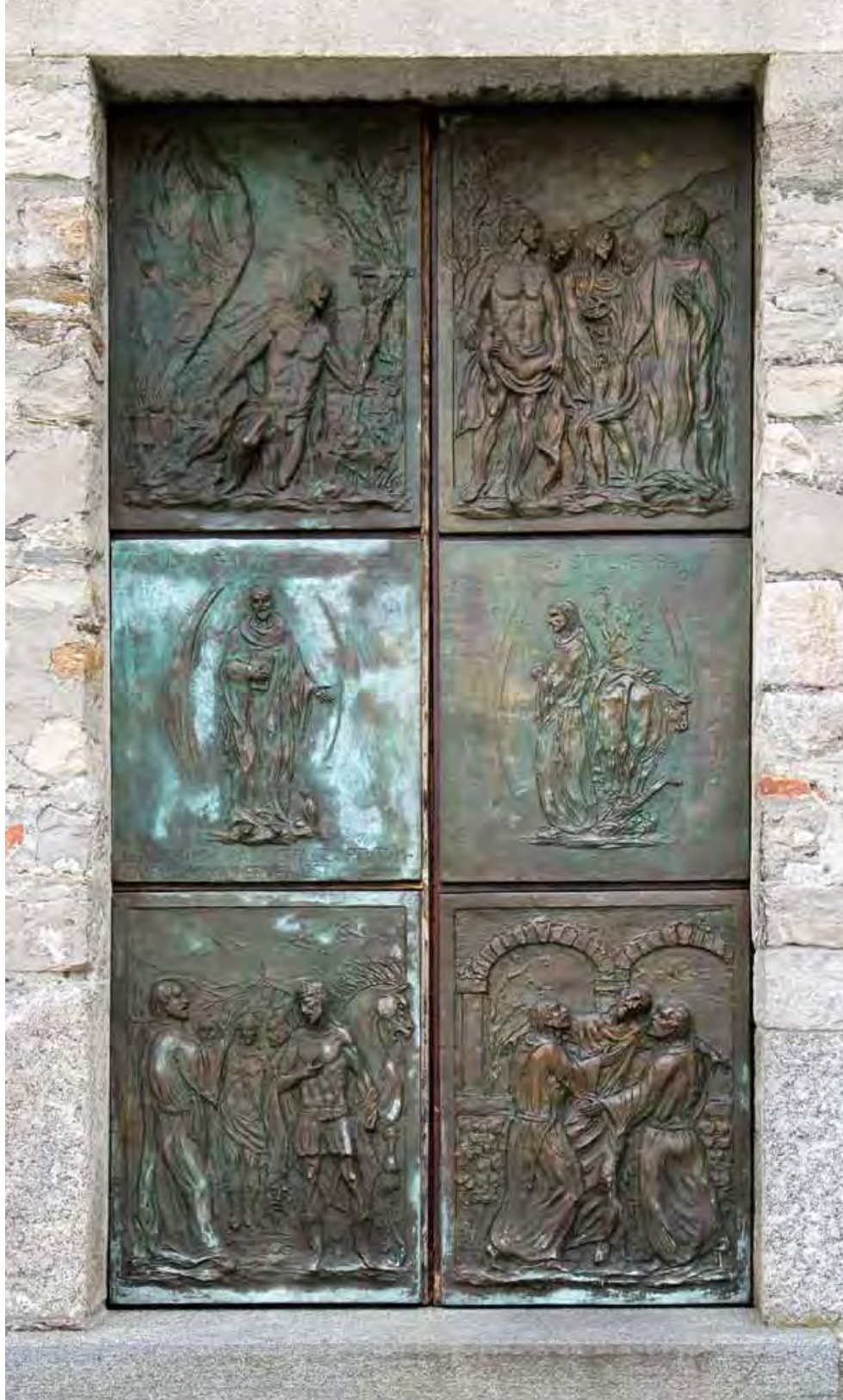
Portale dell'abbazia di Piona Bronzo