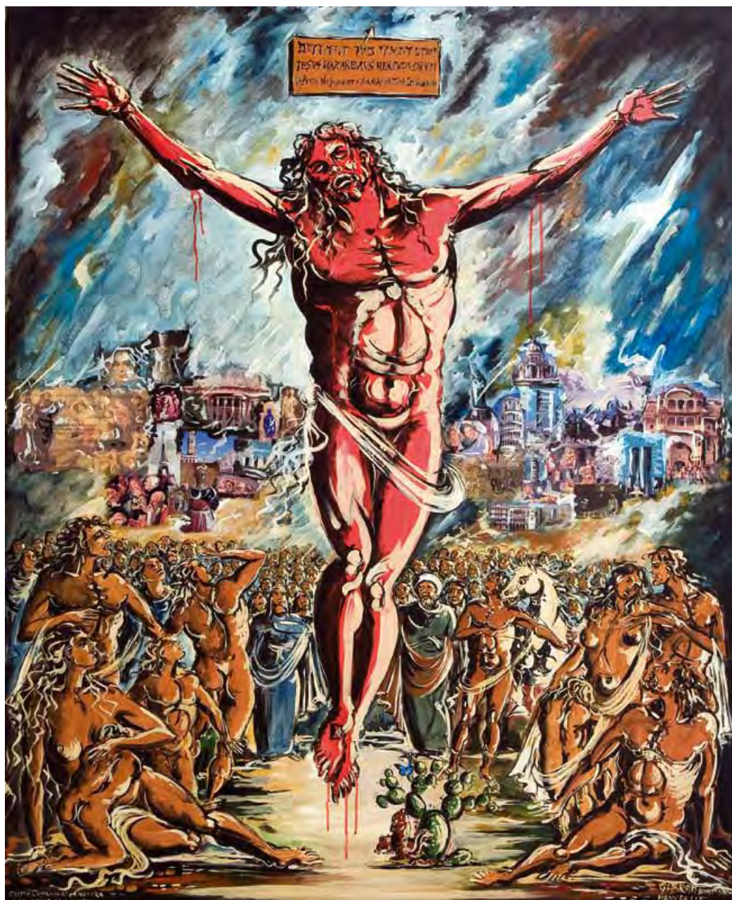
Crocefissione Tecnica mista 150 x 120 cm