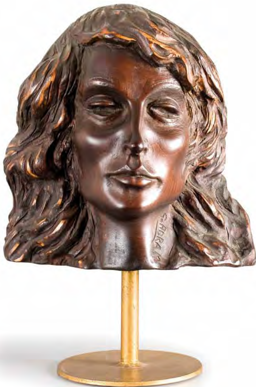
Campana figurata Bronzo