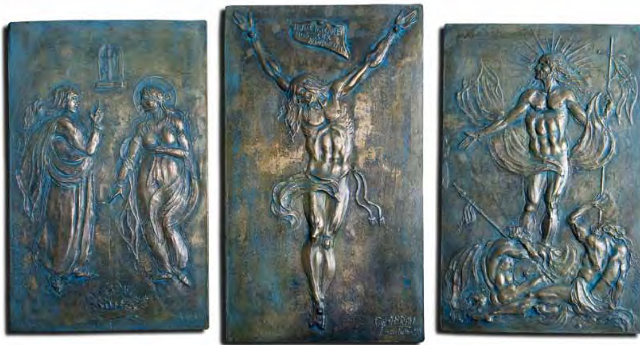
Trittico donato a Giovanni Paolo II Bronzo