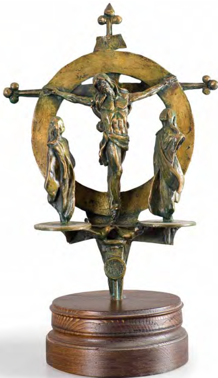
Il giudizio di Salomone