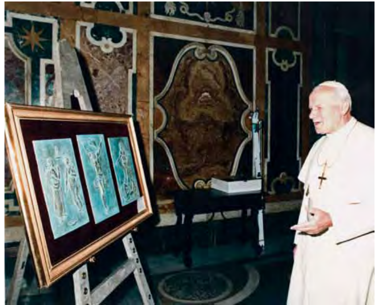
Vaticano, Sala Clementina, Giovanni Paolo II