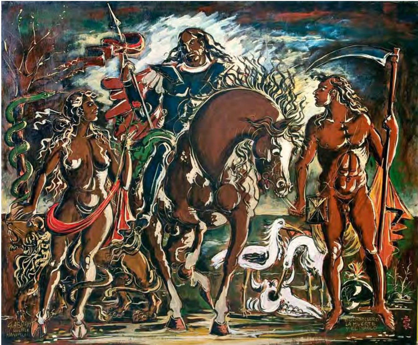
El caballero, la muerte y el diablo Técnica mista 120 x 160 cm