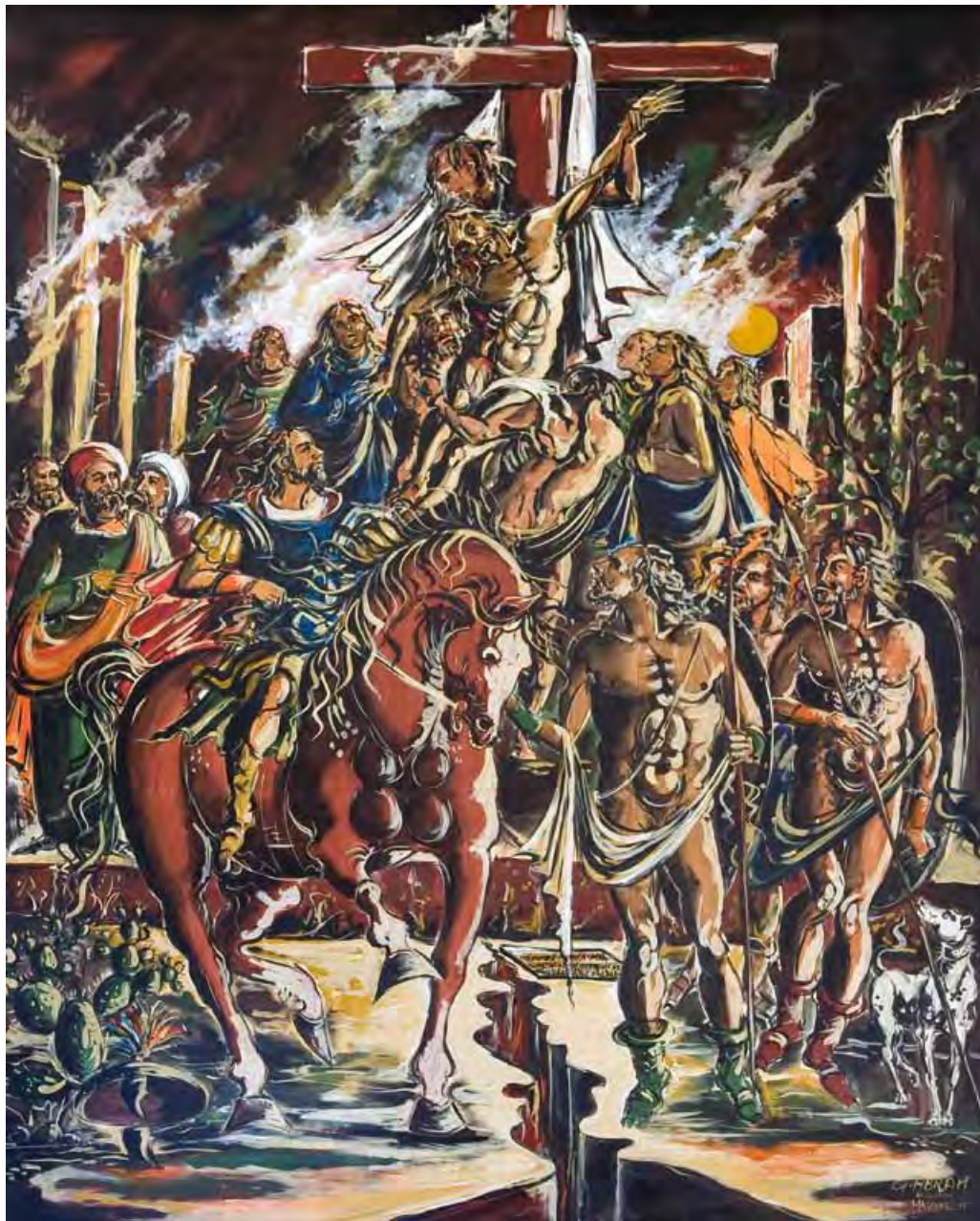
Deposizione Tecnica mista 150 x 120 cm