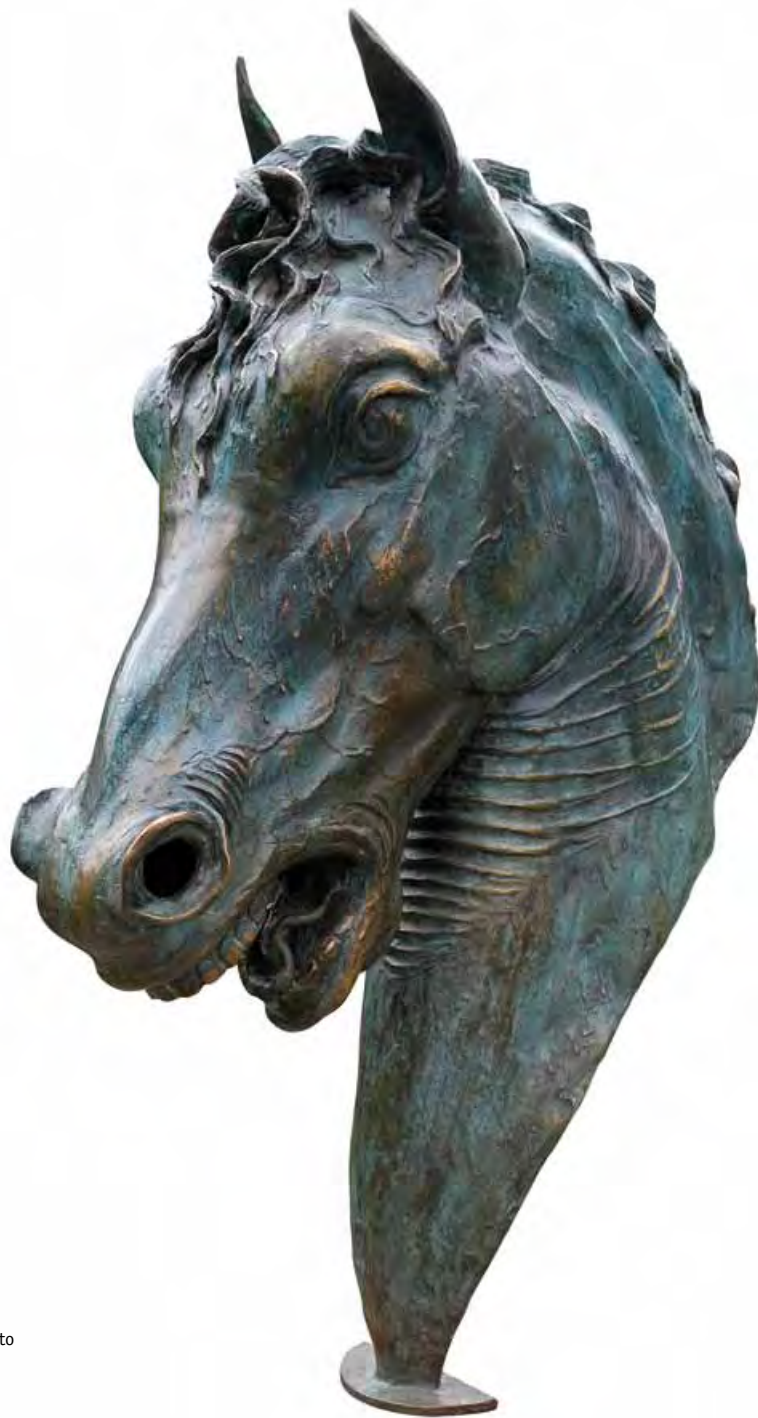
Vescovo sconvolto da un refolo di vento Bronzo