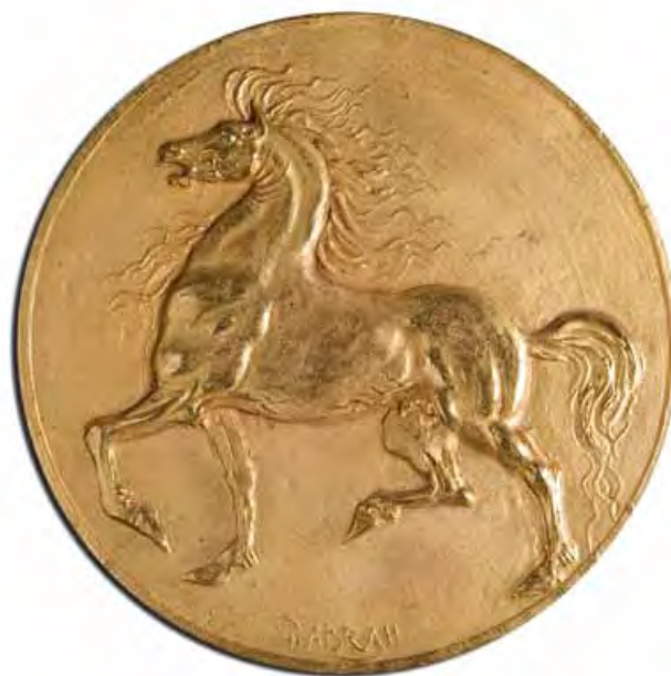
Cavallo al passo Bronzo dorato