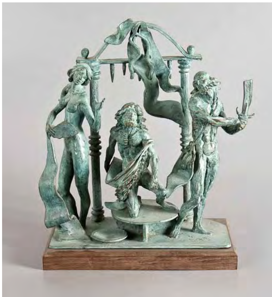
Cista figurata Bronzo